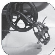
Для затягування педалів скористайтеся гайковим ключем.