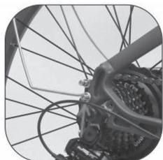
Rear fenders mounted underneath (It's the same on the other side.)