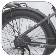
Rear rack mounted in the top two holes (The same on the other side).