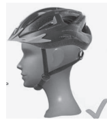
ПРАВИЛЬНА ПОСАДКА – ПЕРЕВІРТЕ, ЧИ ЗАКРИВАЄ ШОЛОМ ЛОБА.