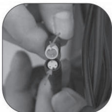
Joints of the same color are connected