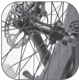
Tighten the screws on both sides