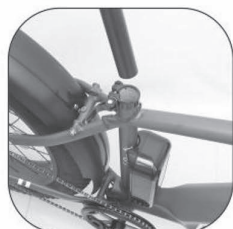
Installation of cushions