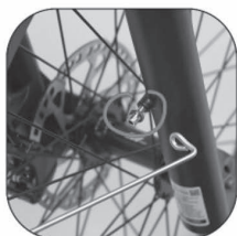
Installing the fenders on the shocks (Shocks come with screws and spacers)