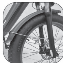
Встановлення крила на амортизатори (амортизатори постачають із гвинтами та прокладками).