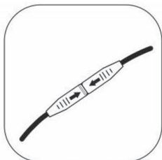
Look closely and you can see the arrows in the joint, arrow to arrow connection