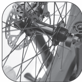
Затягніть гвинти з обох боків.