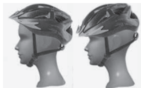
НЕПРАВИЛЬНА ПОСАДКА: ЛОБ ВІДКРИТИЙ ТА ВРАЗЛИВИЙ ДО СЕРЙОЗНИХ ТРАВМ АБО ШОЛОМ ЗАКРИВАЄ ОГЛЯД

ПЕРЕД ПЕРШОЮ ПОЇЗДКОЮ ПОВНІСТЮ ЗАРЯДІТЬ БАТАРЕЮ.