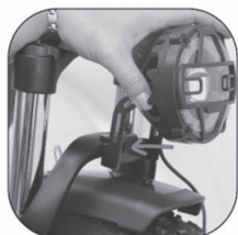
Install headlights and front fenders