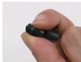
До того, як

Увага: це нормально, коли вушний канал злегка свербить або стискає вушний канал, коли вушний вкладиш вперше контактує з вушним каналом, але це поступово зникне після декількох спроб використання. Однак, якщо ви відчуваєте свербіж весь час після носіння бервух, рекомендується вийняти їх, а потім проконсультуватися з лікарем.